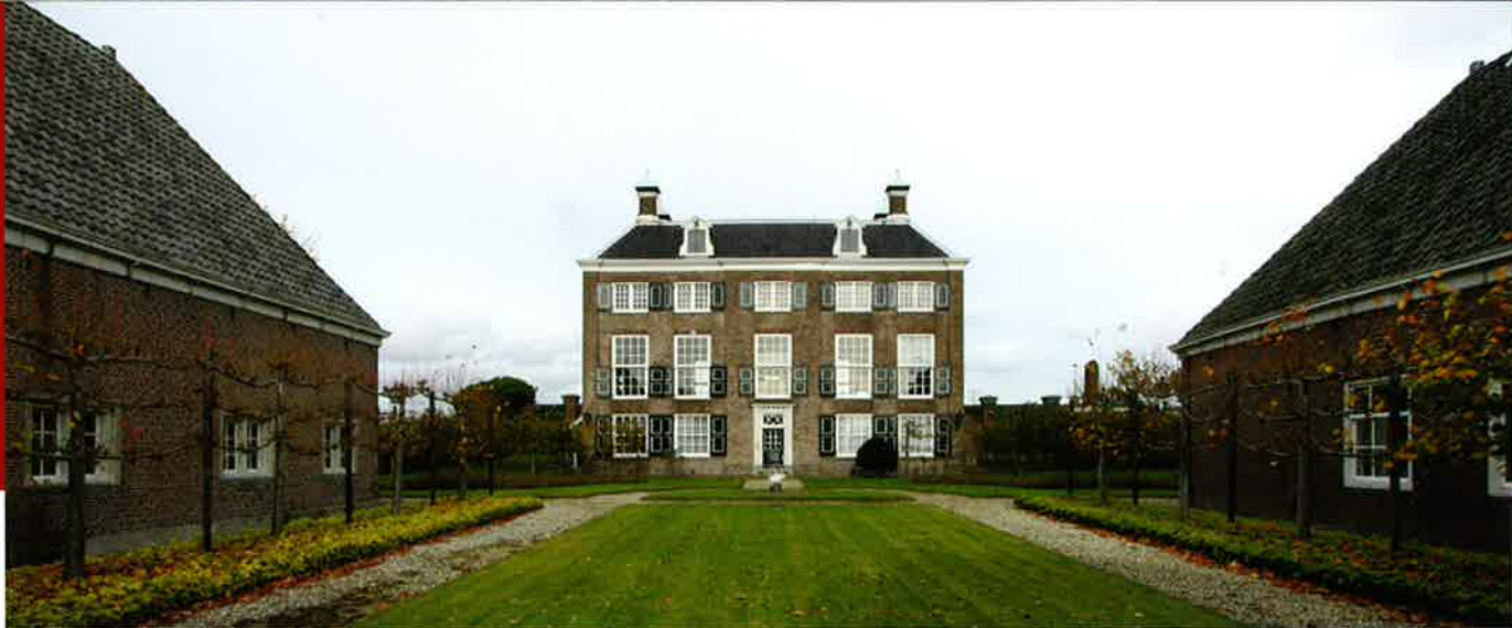
Amsterdam, Diemerzeedijk 27, Gemeenlandshuis.

hadden bedsteden en konden worden gebruikt als slaapvertrekken voor de hoogheemraden, terwijl de hoekvertrekken voorzien werden van schouwen en betegelde muren. De verdieping werd later als kantoor in gebruik genomen, maar de indeling bleef gelukkig bewaard. In het souterrain bevond zich het huishoudelijke onderhuis met bier- en provisiekelders, dienstbodekamertjes met bedsteden, en de grote wit betegelde keuken met aanrecht, pomp en pompbak, slingers en kranen voor put- en regenwater, stookplaats met 'stoof komfooren' en diverse kasten (een 'tinnekas' en een 'spijskamer'). In het souterrain was ook de grote beneden- of Schepenenkamer met grenenhouten vloer, schouw en bedstede. De indeling van het souterrain is bij de restauratie van 1970-'74 ingrijpend gewijzigd. Er kwam toen een beheerderswoning en een archiefkluis. De grote regenwaterkelder, vroeger onder de keuken, is nog wel aanwezig.