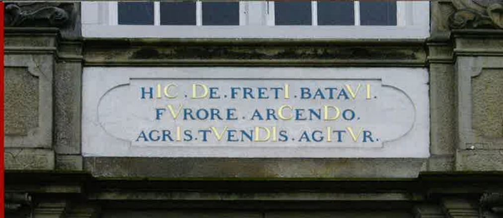
Latijnse spreuk tegen de gevel. De vergulde letters in de tekst vormen het bouwjaar 1726. (foto HdK)

gevel verradert al waar het in het pand om gaat: 'hic de freti batavi furore arcendo agris tuendis agitur', vrij vertaald: 'hier wordt gehandeld over het beveiligen van de landerijen door het temmen van de Bataafse Zee'. De vergulde letters in de tekst vormen samen het jaar 1726.