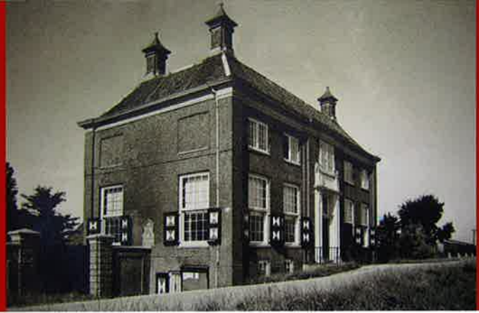
Amsterdam, Diemerzeedijk 27, Gemeenlandshuis, voorgevel. (foto Jaap d'Oliveira, 1949)

Verervingen De drie verervingen die in 2008 tot stand kwamen, tonen aan dat in die negentig jaar onze Vereniging voor de continuïteit van het behoud van vooral bijzondere monumenten een belangrijke positie heeft ingenomen. In alle drie de gevallen heeft de voormalige eigenaar ervoor gekozen, dat het pand het best bewaard blijft in ons bezit. Vorig verslagjaar was al melding gemaakt van de overeenkomst die met de Koninklijke Hollandische Maatschappij der Wetenschappen was bereikt over de overdracht van het 'Hodshon Huis' aan het Spaarne 15A-17 te Haarlem. Ook het Hoogheemraadschap van Amstel, Gooi en Vecht oordeelde dit jaar dat hun Gemeenlandshuis bij onze Vereniging in veilige handen was. Beide verervingen gingen overigens gepaard met omvangrijke financiële gevolgen wegens de restauratieverplichting en in het geval van het 'Hodshon Huis' ook met een koopsom. In beide gevallen maakte de BankGiro Loterij met haar ruimhartige bijdrage de transactie mogelijk.