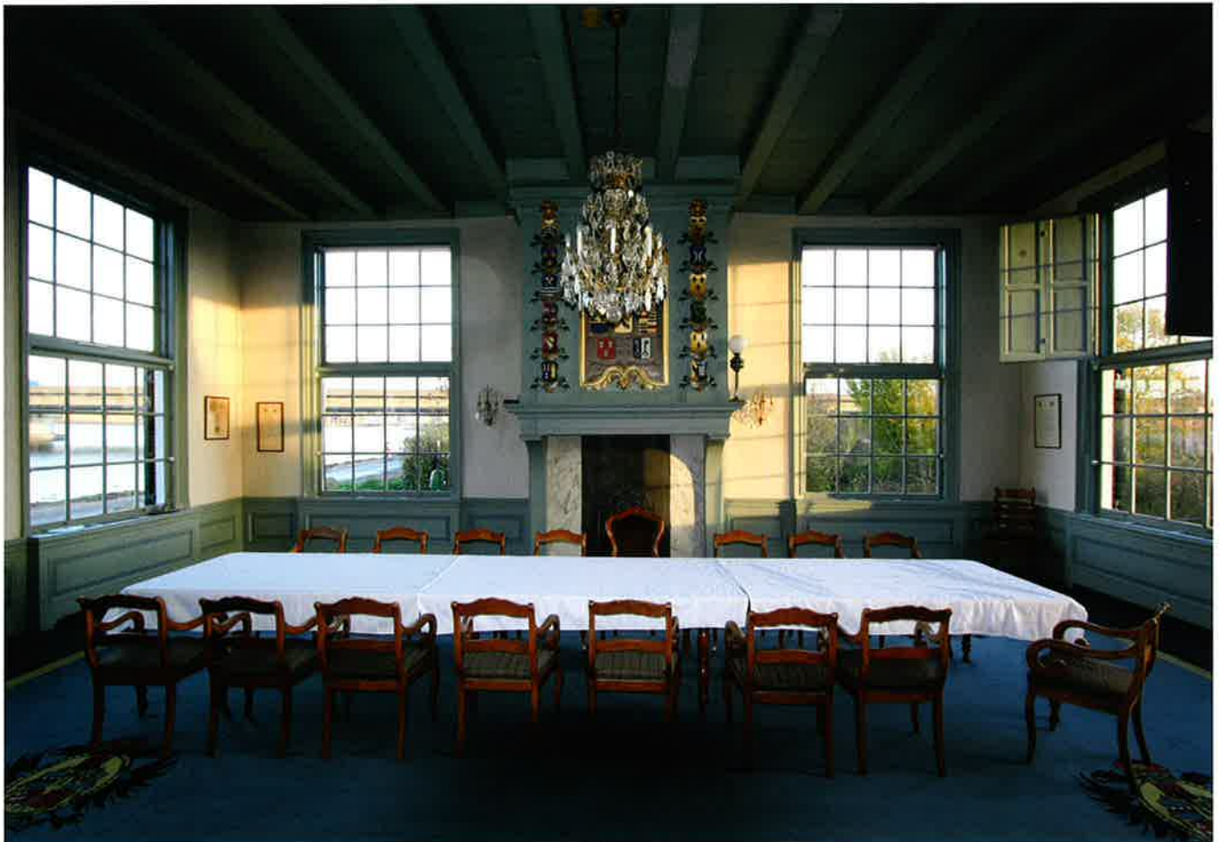
De vergaderzaal met schouw en houtsnijwerk door Pieter le Normant.

de rechterzijde van de middenhal. Hier was bij de bouw de eetzaal gesitueerd en waren nog twee aparte achterkamertjes afgetimmerd, elk met bedstede en kast, en een secreet (toilet). Boven deze achterkamertjes was een insteekverdieping, toegankelijk via de bordestrap in de middenhal, met twee kamertjes, een met bedstede en een met een alkoof en kasten. De eetzaal functioneerde vanaf 1868 als aanbestedingslokaal met een grote houten balie waar jaarlijks in april het grasland en om de vier jaar de jacht werd verpacht. In 1970-'74 werden de vertrekken en de insteekverdieping weggebroken en werd hier de secretarie gevestigd. Van de oorspronkelijke situatie is de roodgaderde marmeren schouw bewaard met houtsnijwerk rond de spiegel van Pieter le Normant. Le Normant maakte in 1727 ook het houtsnijwerk voor de grote bordestrap in de middenhal. Op de verdieping zijn negen kamers afgetimmerd. Vier kamertjes