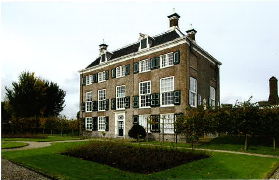
Amsterdam, Diemerzeedijk 27, Gemeenlandshuis.

Het gaat steeds vaker om huizen die door hun interieur of hun structuur zo kwetsbaar zijn, dat zij voor hun historisch verantwoorde instandhouding het best professioneel beheerd kunnen worden. In de drie hiervoor genoemde gevallen hebben de voormalige eigenaren ingezien dat je dat in deze gevallen beter niet aan de markt kunt overlaten.