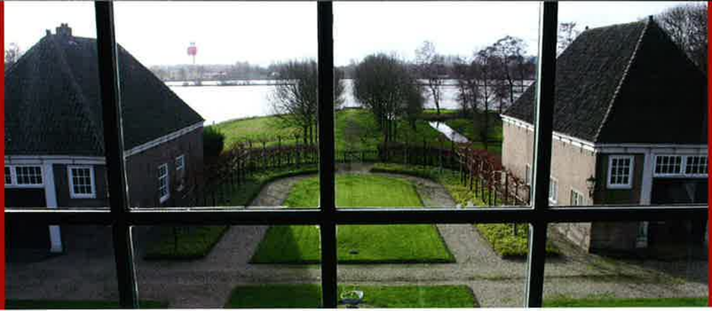
Stal, koetshuis en erf gezien vanuit het Gemeenlandshuis.